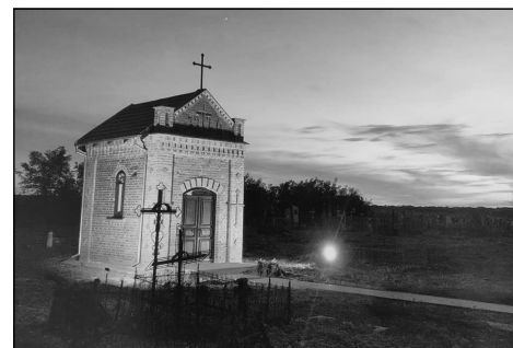
Kaple na Martinovce

Dovolu, abych Vám předal finanční příspěvek, který na tuto pamětní desku naši krajané věnovali.“