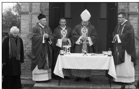
Svěcení kaple na Martinovce