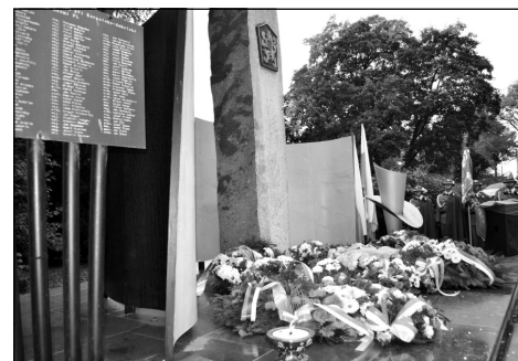
Pomník 2. čsl. paradesantní brigády v Nowosilcích

účastnili pietních a vzpomínkových akcí v Polsku. Nejprve na vojenském hřbitově v polské Dukle, dále v Zarszyně kde se nachází pomník 2. čs. paradesantní brigády a posléze v Nowosilcích. Zde se nacházela nemocnice a byly zde také pohřbeny necelé dvě stovky padlých příslušníků paradesantní brigády.